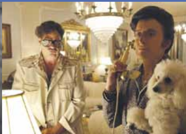
Wielki Liberace, reż. Steven Soderbergh Highlights