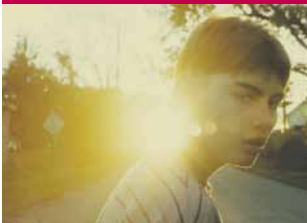
The Cold Lands, reż. Tom Gilroy Spectrum