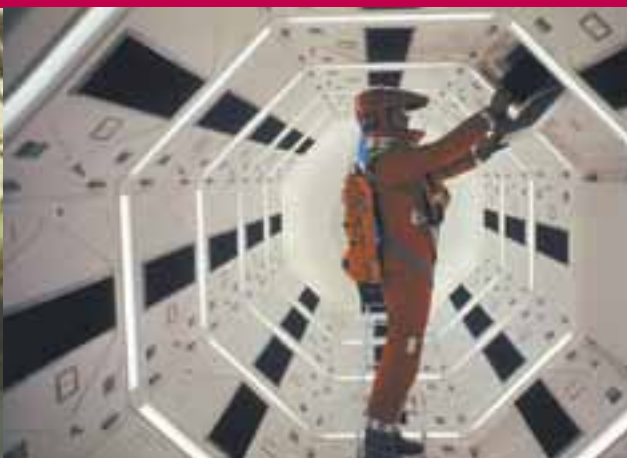
2001: Odyseja kosmiczna, reż. Stanley Kubrick Arcydzieła amerykańskiego kina. 90 lat Warner Bros.