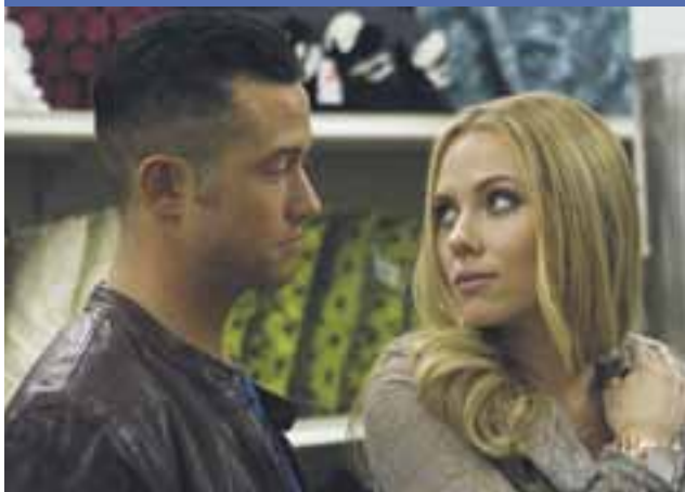
Don Jon, reż. Joseph Gordon-Levitt Festival Favorites

kino | nowe horyzonty kazimierza wielkiego 19a-21, 50-077 wrocław