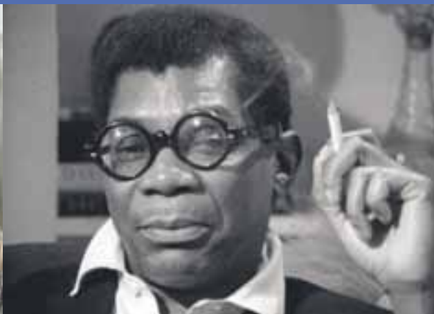
Portret Jasona, reż. Shirley Clarke Retrospektywa Shirley Clarke